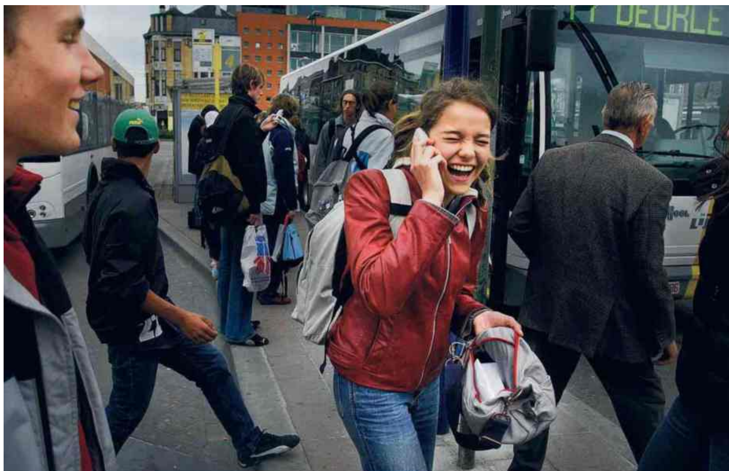
Een leven zonder gsm? Geen jongere die het zich nog kan voorstellen.

dat de gsm hét product is dat je moet hebben om erbij te horen. Daarmee scoort de gsm veel beter dan de bromfiets (8 procent), computer (6 procent), kledij en een mp3-speler (3 procent). 'De gsm biedt jongeren de zekerheid om zich nooit en nergens meer eenzaam te voelen', zegt jongerenexpert Joeri Van den Bergh. Het garandeert hen dat ze op elk moment in contact kunnen staan